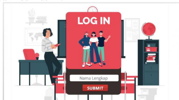
Gambar 1. Menu Login Pengguna

Hasil dari pengembangan yaitu pada media pembelajaran berbasis Articulate Storyline 3 terdiri dari beberapa tampilan yaitu tampilan sign in , tampilan log in (untuk input identitas pengguna), tampilan tujuan media pembelajaran, dan tampilan menu materi yang terdiri dari pendahuluan, pengertian, tujuan dan fungsi, prinsip evaluasi serta alat evaluasi. Adapun hasil pengembangan dapat dilihat pada Gambar 1 - Gambar 4 berikut ini.