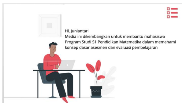
Gambar 2. Tampilan Tujuan Pembelajaran