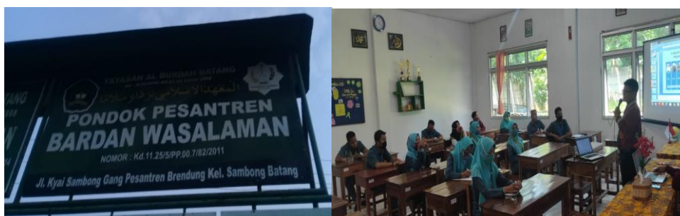
Gambar 2. Kegiatan Pelatihan Guru di Pondok Pesantren Bardan Wasalaman

Tahap Kedua, pemberdayaan Guru melalui pelaksanaan tindakan dengan memberikan pengetahuan dan pemahaman kepada para Guru Pondok Pesantren Bardan Wasalaman dari proses hingga hasil pembelajaran. Pemberdayaan bertujuan menjadikan masyarakat mandiri dan mampu mengatasi permasalahannya sendiri, bukan menjadikan masyarakat tergantung pada pihak luar (Muslim, 2017:81). Pendidikan Pesantren merupakan sebagai wadah dalam melakukan proses pendidikan masyarakat sekaligus modal sosial yang terus diberikan penguatan dan penghargaan untuk terus melakukan transformasi manusia seutuhnya (Aulia dkk, 2018:74). Proses pengembangan dunia pesantren harus didukung oleh Pemerintah secara serius sebagai proses pembangunan manusia seutuhnya. Meningkatkan dan mengembangkan peran pesantren dalam proses pembangunan di era otonomi daerah merupakan langkah strategis dalam upaya mewujudkan tujuan pembangunan Nasional terutama sektor pendidikan (Syafe'i, 2017:64). Dalam mewujudkan pendidikan pesantren yang berkualitas sehingga dilakukan upaya pemberian tindakan kepada para guru pondok pesantren melalui (1) pelatihan penyusunan kurikulum, silabus dan RPP, (2) pelatihan penelitian tindakan kelas, dan (3) pelatihan penyusunan dan analisis instrument penilaian. Menurut Mulyasa, (2005:13-14) untuk mengukur kualitas guru setidaknya dapat ditinjau dari dua aspek yaitu dari aspek proses dan aspek hasil pembelajaran.