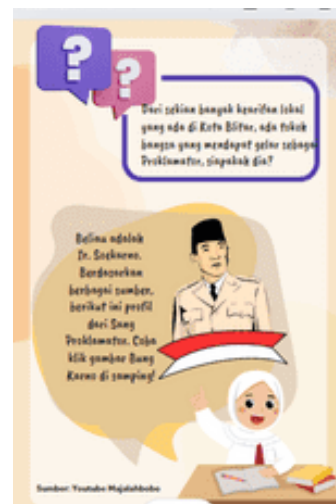
Gambar 6. Tampilan profil Sang Proklamator pada LKPD e-book