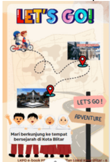
Gambar 7. Tampilan LKPD e-book berkunjung ke tempat bersejarah di Kota Blitar

Setelah siswa berkunjung dan menggali pengetahuan di tempat-tempat bersejarah itu, kemudian siswa membuat laporan kunjungan sesuai kreativitas siswa masing-masing. Siswa akan berlomba membuat laporan kunjungan sebegus mungkin.