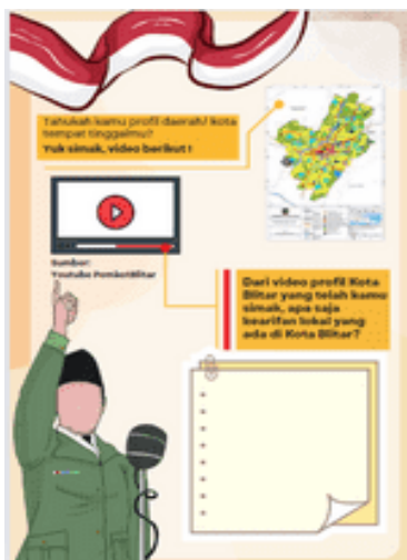
Gambar 5. Tampilan kearifan local Kota Nliar pada LKPD e-book

Pada LKPD e-book ini materi pengantar terkait kearifan lokal Kota Blitar diawali dengan adanya video tentang profil Kota Blitar. Siswa akan dengan mudah menekan menu play pada halaman tersebut. Selanjutnya siswa mengidentifikasi kearifan lokal apa saja yang ada di Kota Blitar. Berikutnya, kearifan lokal Kota Blitar terkait adanya tokoh pahlawan Proklamator pejuang kemerdekaan Republik Indonesia, yaitu Ir. Soekarno. Siswa dapat mempelajari profil Sang Proklamator dengan menyimak video yang disajikan dalam gambar sang tokoh.