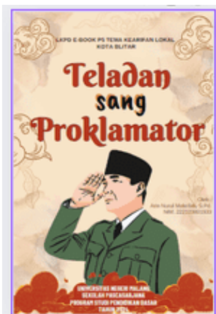
Gambar 1. Keterangan Cover/sampul LKPD e-book

Petunjuk penggunaan LKPD e-book diperuntukkan supaya siswa lebih mudah dalam menggunakan LKPD e-book tema kearifan lokal Kota Blitar. Petunjuk ini berisi kalimat instruksi yang mudah dipahami siswa. Berikut petunjuk penggunaan LKPD e-book .