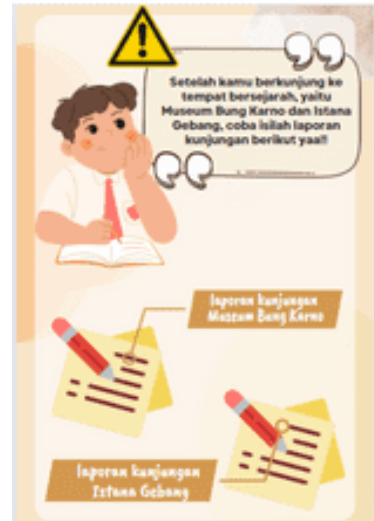
Gambar 8. Tampilan pada LKPD e-book berupa laporan kunjungan tempat bersejarah di Kota Blitar