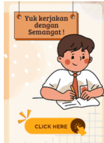
Gambar 4. Tampilan menu untuk menyajikan pertanyaan pemantik pada LKPD e-book