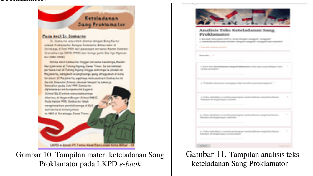
Gambar 10. Tampilan materi keteladanan Sang Proklamator pada LKPD e-book

Pada penghujung LKPD e-book ini berisi analisis teks keteladanan Sang Proklamator. Siswa akan mengisi g.form yang disajikan dengan menekan tombol saja sehingga lebih mudah. Berikut merupakan tampilan g.form terkait analisis teks keteladanan Sang Proklamator.