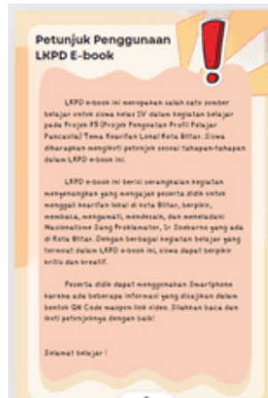
Gambar 2. Petunjuk Penggunaan LKPD