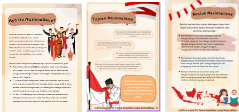
Gambar 9. Tampilan materi nasionalisme pada LKPD e-book

Pada LKPD e-book ini juga disajikan materi tentang definisi, tujuan, bentuk dan beberapa contoh nasionalisme yang dapat dipelajari siswa. Siswa akan memahami nasionalisme dari paparan materi yang ada ini kemudian nanti dapat mengaplikasikan nilai nasionalisme dalam kehidupan sehari-hari.