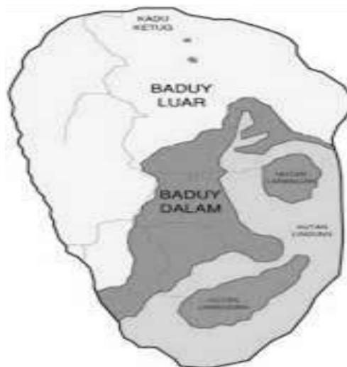
Gambar 1. Kawasan Penelitian Baduy, Desa Kenakes, Leuwidamar, Lebak, Banten

Metode yang digunakan adalah kualitatif deskriptif. Materi tumbuhan dikumpulkan secara snowball sampling . Waktu pelaksanaan penelitian dimulai dari bulan Maret – Juli 2022 di Desa Kanekes, Kecamatan Leuwidamar, Kabupaten Lebak-Rangkasbitung, Banten. Alat-alat yang diperlukan untuk penelitian ini Kamera canon 600d untuk mendokumentasikan kekhasan objek, lokasi penelitian dan mekanisme penelitian, GPS garmin 78S untuk penentuan posisi atau letak lapangan, Luxmeter untuk mengukur intensitas cahaya, Soil Tester untuk mengukur kelembaban tanah, thermohyrometer digital TFA untuk mengukur suhu dan kelembaban, Meteran untuk mengukur plot pengamatan, parang untuk membuat jalur lintasan, alat tulis menulis. Teknik pengambilan sampel: (1) survey lapangan yaitu penjelajahan bebas dilakukan pada kawasan baduy jero yaitu cibeo, cikertawana dan cikeusik